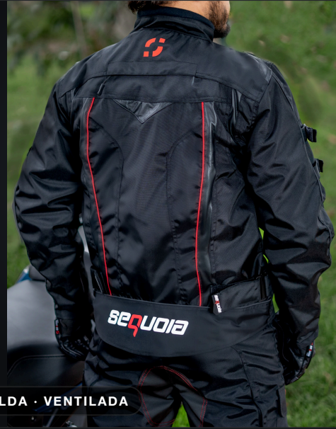
ESPALDA · VENTILADA