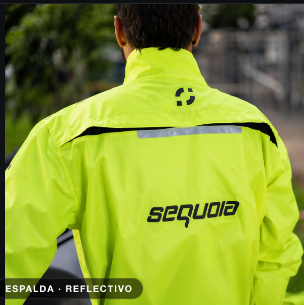
ESPALDA · REFLECTIVO

Tipo Chaqueta impermeable touring Impermeabilidad 100% — costuras termoselladas Visibilidad Color neón + estampados reflectivos Ventilación Entrada de aire en la parte alta de la espalda Bolsillos Dos delanteros Ajustes Velcro en muñecas + resorte trasero