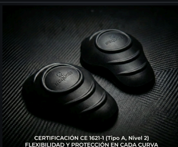
CERTIFICACIÓN CE 1621-1 (Tipo A, Nivel 2) FLEXIBILIDAD Y PROTECCIÓN EN CADA CURVA