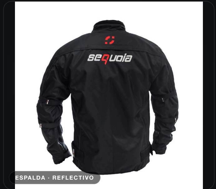
ESPALDA · REFLECTIVO